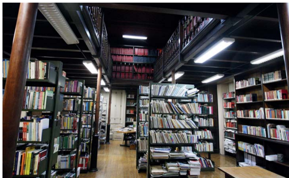
Biblioteca especializada, com coleções de livros e periódicos em várias áreas jurídicas

Situado no alto de uma colina entre os rios Tamanduateí e Anhangabaú, o primeiro conjunto de edificações da capital foi construído a partir de 1554, em local escolhido pelos padres jesuítas, para dar início à catequização dos moradores originais da região, os índios. O complexo situado a cerca de 300 metros da estação Sé do metrô, na região central, abriga em seu entorno os prédios da Secretaria Estadual da Justiça e da Defesa da Cidadania e do Tribunal