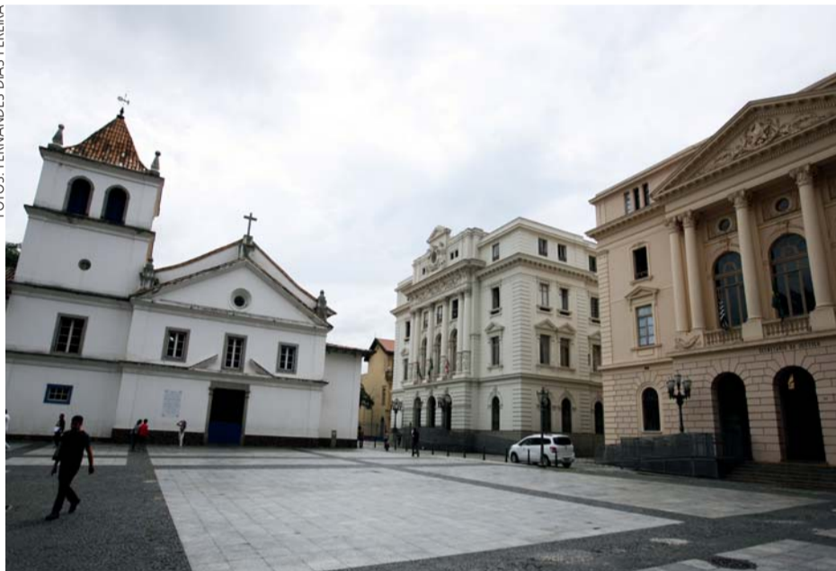
Pátio do Colégio e os prédios gêmeos da Pasta da Justiça e da Defesa da Cidadania