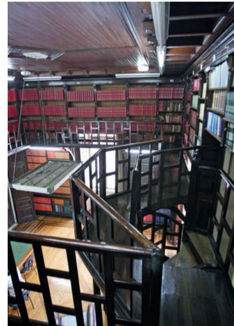
Estantes e escadas em madeira de lei

Roteiros de metrô incluem visitas a museus e bibliotecas, como a da Secretaria Estadual da Justiça e Defesa da Cidadania, no centro